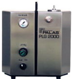
PLG 2000 H Heizbare Version des PLG 2000 bis 100°C