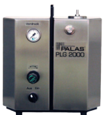
PLG 2000 HS Heizbare Version des PLG 2000 mit automatischer Nachfülleinheit