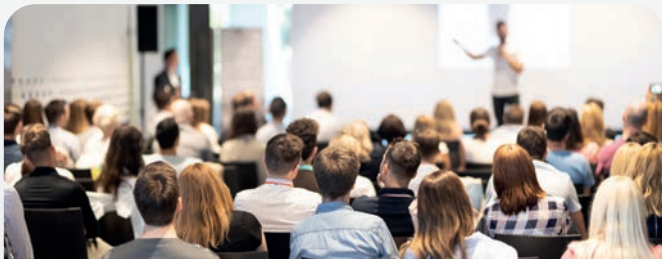
KONFERENZEN & VORTRÄGE